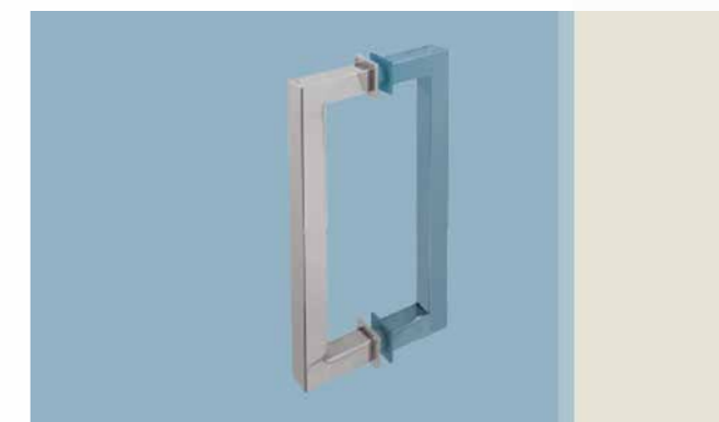
Tirador fijo (doble o simple)