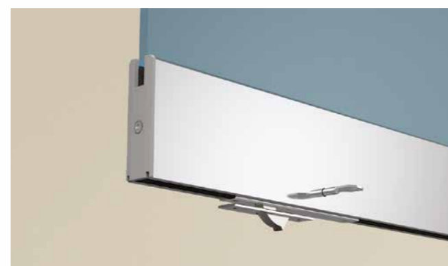
Cerradura en hoja para la apertura