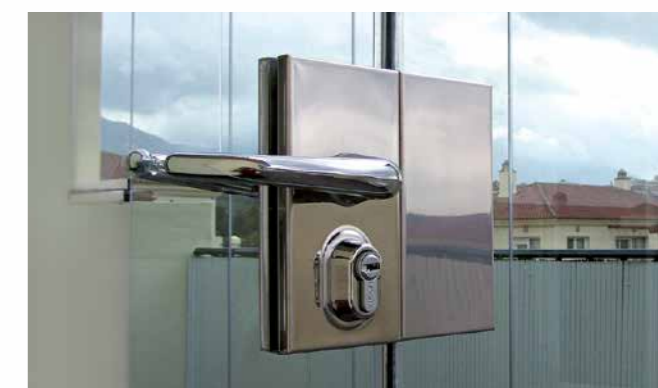
Cerradura en vidrio tipo petaca