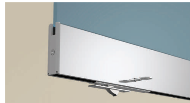
Serratura in anta per l'apertura