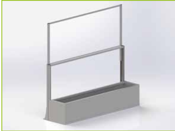
Opción cortavientos + macetero con soporte estándar a suelo.

Acondicione su terraza con el nuevo macetero para su cortavientos.