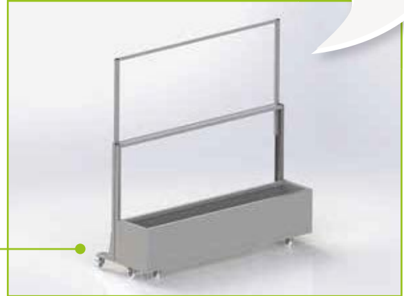
Opción cortavientos + macetero con soporte de ruedas.