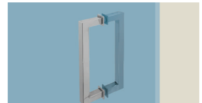
Bügelgriff (doppelt oder simpel)